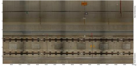
Hochauflösende Scanaufnahme, Orthobildabwicklung Oberbau und bahntechnische Ausrüstung